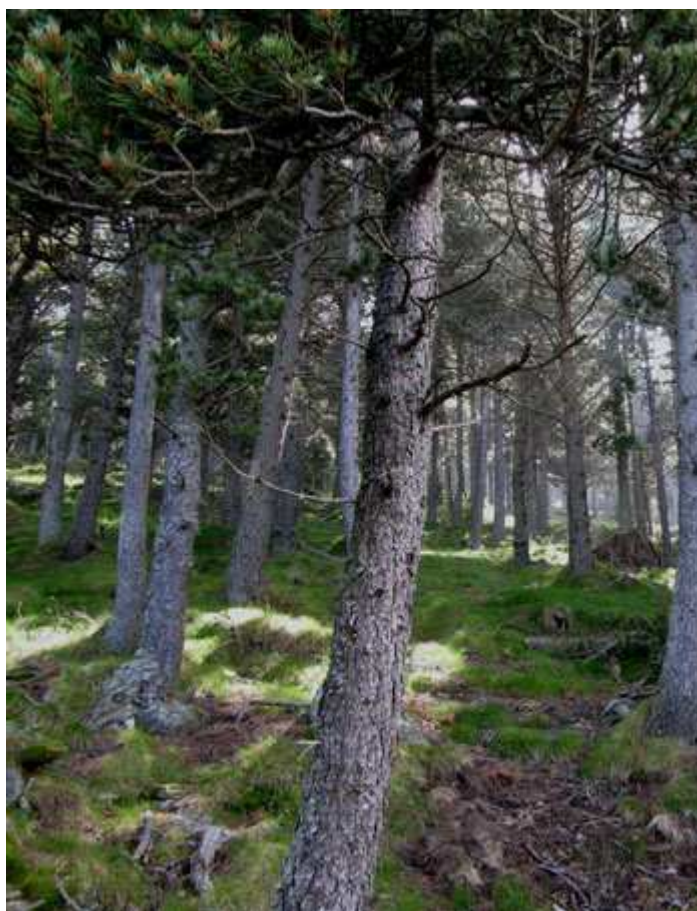
Pujada entre pins pel Serrat de l'Atalaiador